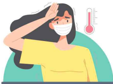
발열, 메스꺼움, 근육통