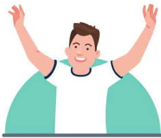
건강상태 좋을 때 접종