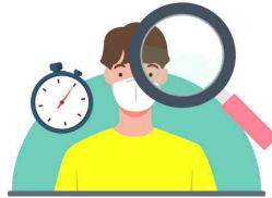
접종기관에서 이상 반응 관찰